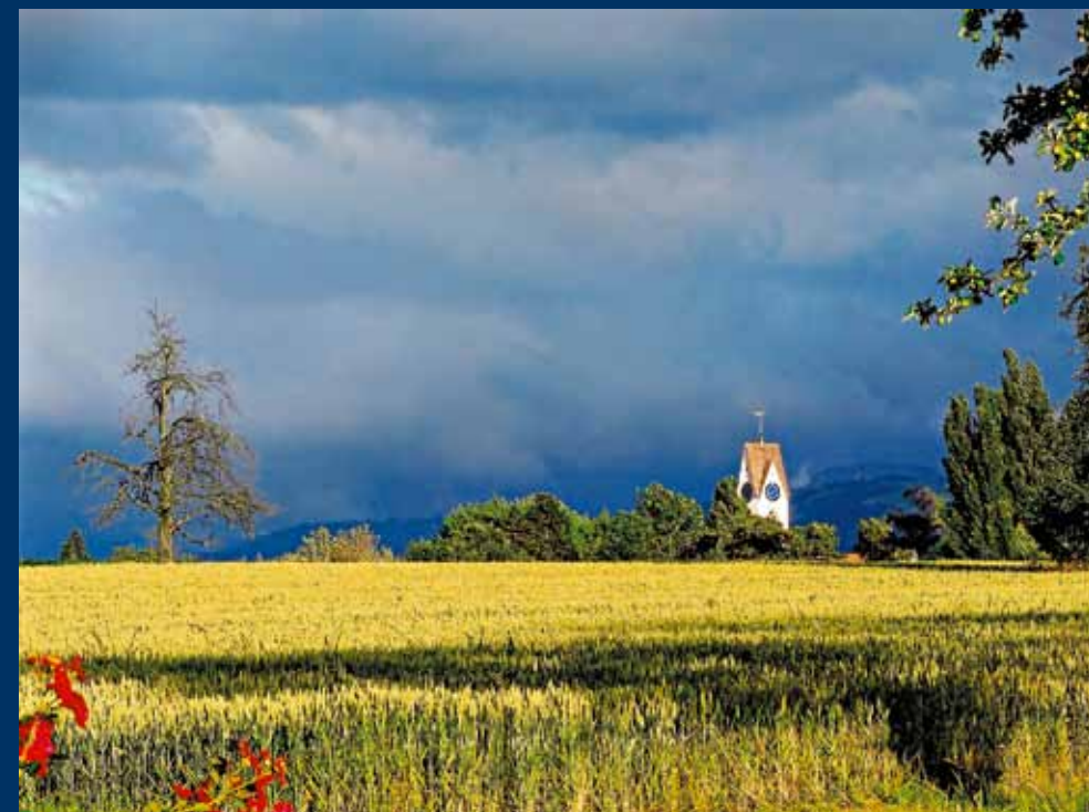
Dollikerstrasse, Fritz Haab

Ausstellung im Uetiker Museum November 2011 bis April 2012